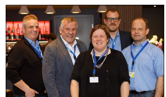
Das Team von Boss Holzbau